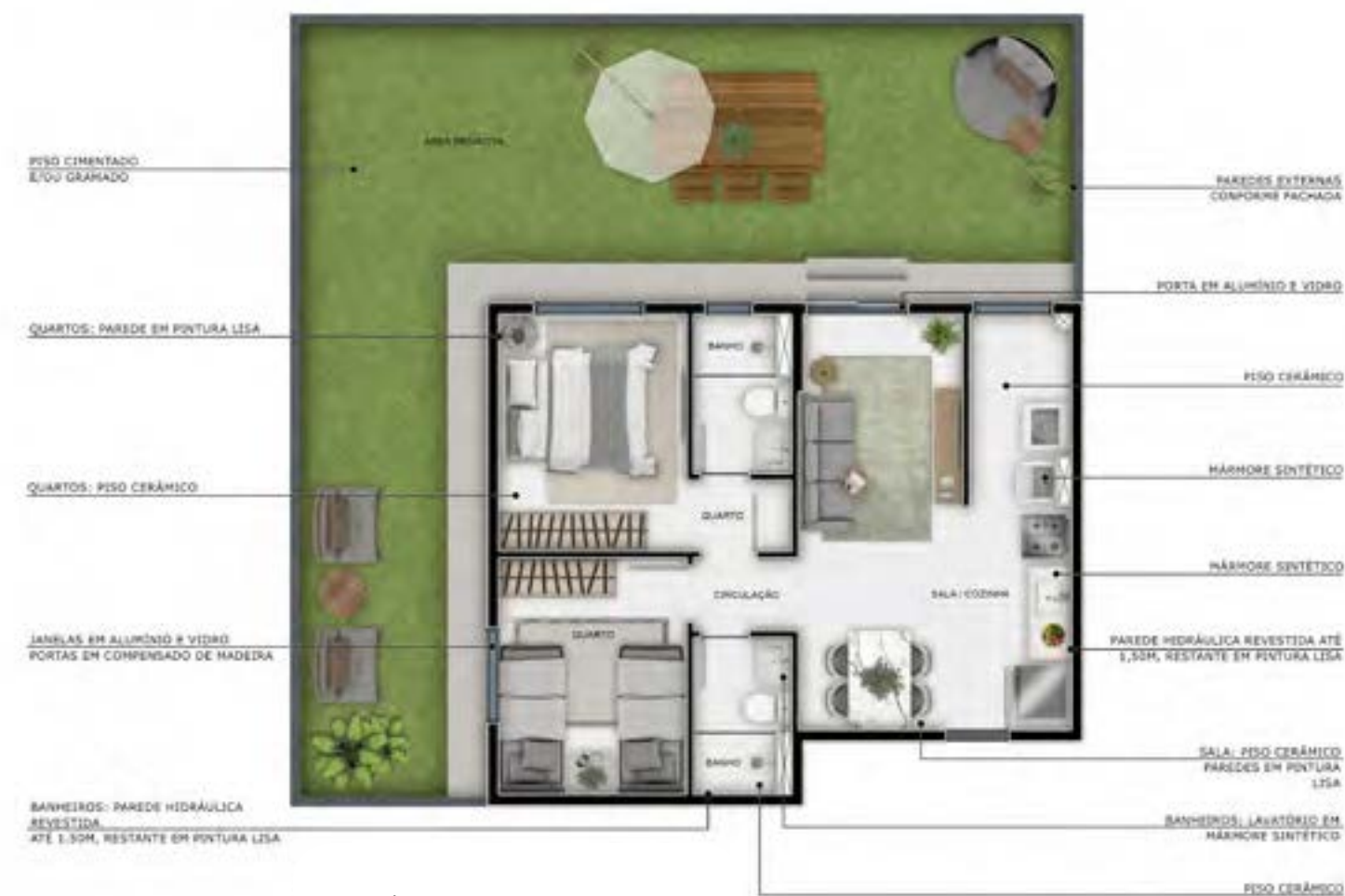
Apto 03 | Torre 04