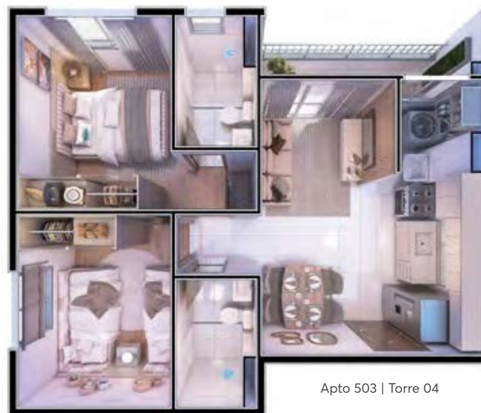
Apto 503 | Torre 04