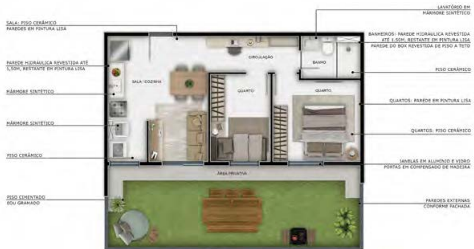
Apto 01 | Torre 04

JÁ ESCOLHEU A SUA VERSÃO DE QUALIDADE DE VIDA HOJE?