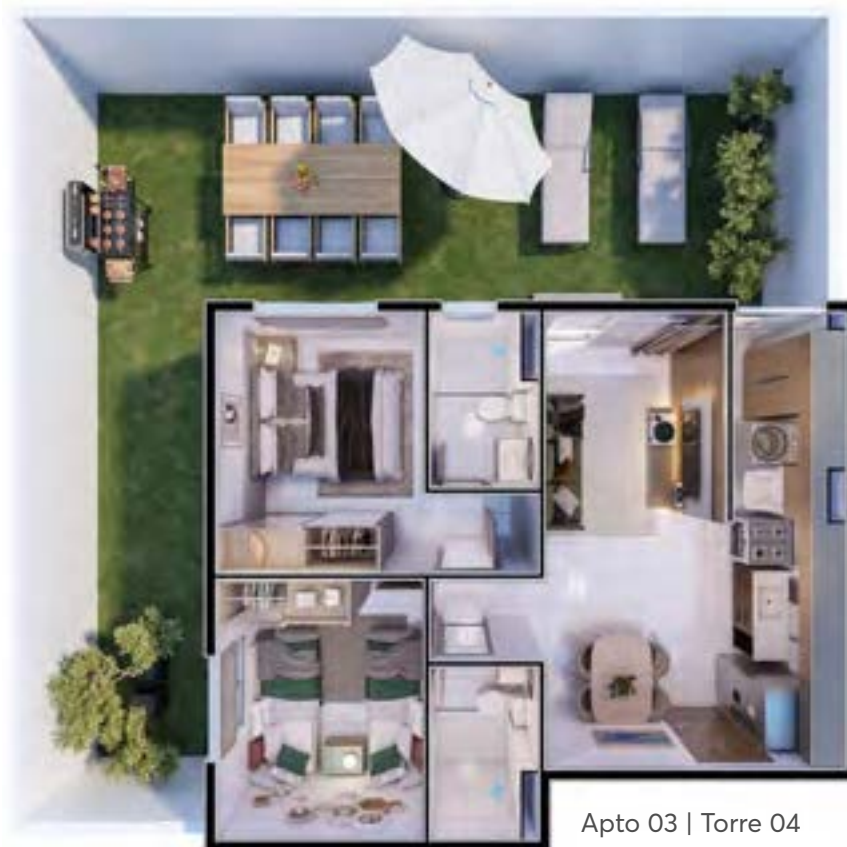
Apto 03 | Torre 04