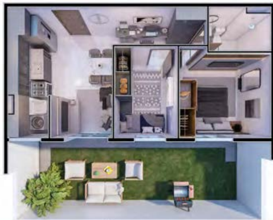
Apto 01 | Torre 04