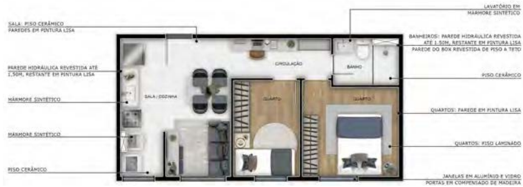
Apto 501 | Torre 04