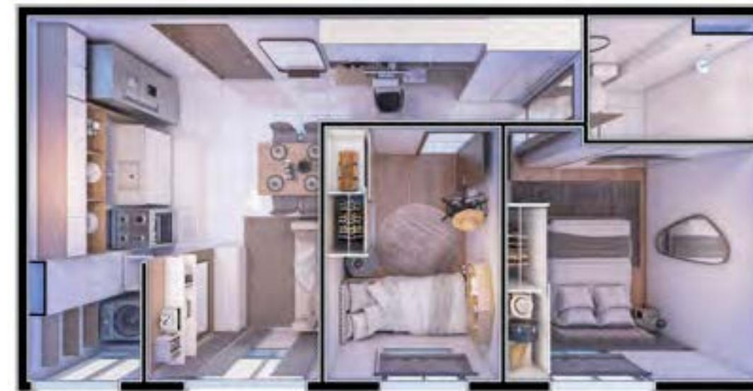
Apto 501 | Torre 04