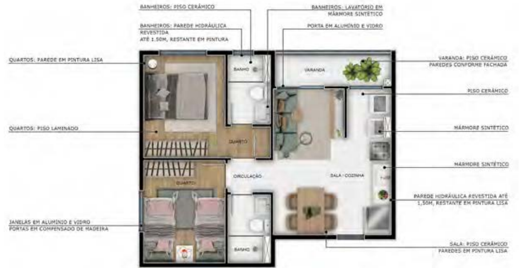
Apto 503 | Torre 04